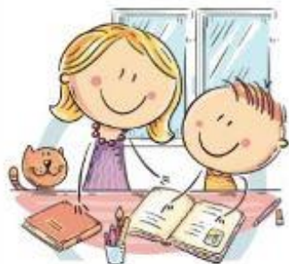
1. ЕСТЕСТВЕННОЕ ОСВЕЩЕНИЕ

ЕДИНЬИЙ КОНСУЛЬТАЦИОННЫЙ ЦЕНТР РОСПОТРЕБНАДЗОРА 8-800-555-49-43