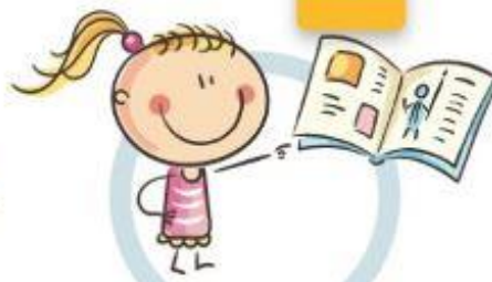
3. РАССТОЯНИЕ ДО КНИГ