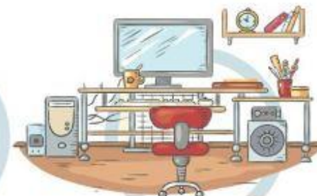
5. СООТВЕТСТВИЕ МЕБЕЛИ