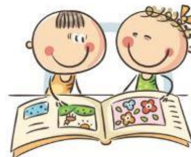
4. УПРАЖНЕНИЯ ГИМНАСТИКИ ГЛАЗ