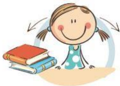
1. ФИЗКУЛЬТМИНУТКА ДЛЯ УЛУЧШЕНИЯ МОЗГОВОГО КРОВООБРАЩЕНИЯ