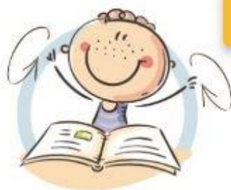
2. ФИЗКУЛЬТМИНУТКА ДЛЯ СНЯТИЯ УТОМЛЕНИЯ С ПЛЕЧЕВОГО ПОЯСА И РУК