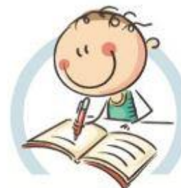
4. СИДИТЕ ПРАВИЛЬНО