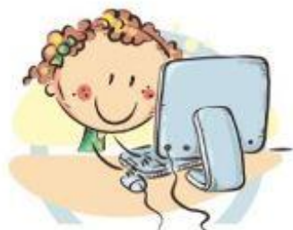
2. ПОЛОЖЕНИЕ МОНИТОРА